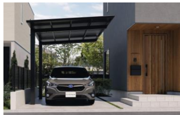
ビームス(サイドパネル)