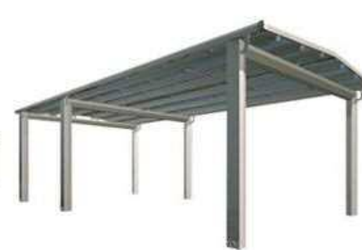
半支持タイプ（合掌仕様） 耐積雪荷重：600N/m 2