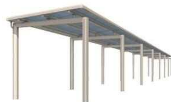
両支持タイプ 耐積雪荷重：600N/m 2