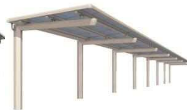
一本柱タイプ（偏心柱） 耐積雪荷重：600N/m 2